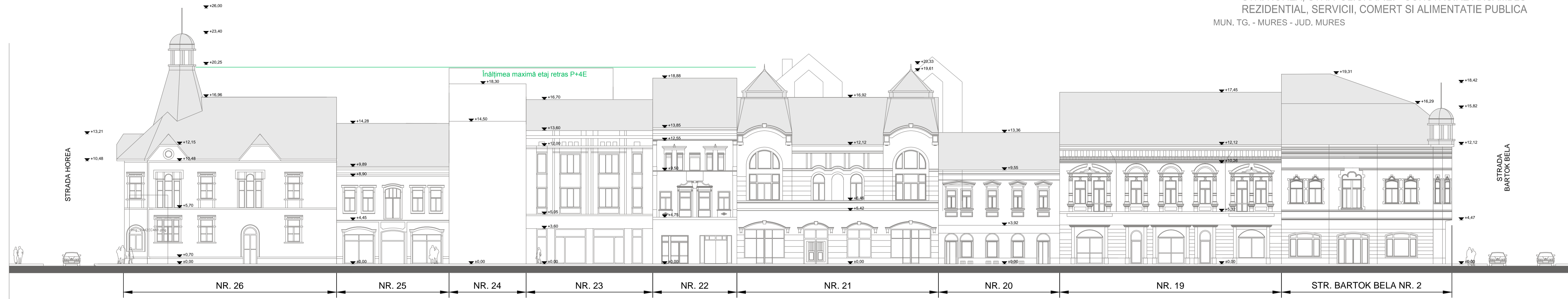
DESFASURATA STRADALA - PIATA TRANDAFIRILOR

P.U.Z. PENTRU SUBZONA CONSTRUITA PROTEJATA A MUN. TG. - MURES DELIMITATA DE PIATA TRANDAFIRILOR, STR. BARTOK BELA, STR. HOREA, STR. POLIGRAFIEI - CONSTRUIRE ANSAMBLU REZIDENTIAL, SERVICII, COMERT SI ALIMENTATIE PUBLICA MUN. TG. - MURES - JUD. MURES